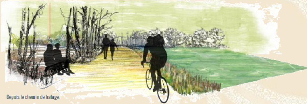
Depuis le chemin de halage.

Ces panneaux sont le fruit du travail des étudiants. La Communauté de Communes dégage toute responsabilité concernant les orientations et propositions formulées par l'école et figurant dans le CRAPAUD. Elles ont été présentées aux commanditaires mais n'ont pas été validées par eux. Nous sollicitons votre indulgence par rapport à d'éventuelles erreurs, inexactitudes ou fautes d'orthographe. Ce travail reste un travail d'étudiants et n'engage en rien la collectivité.