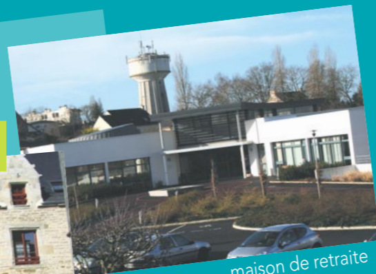
maison de retraite