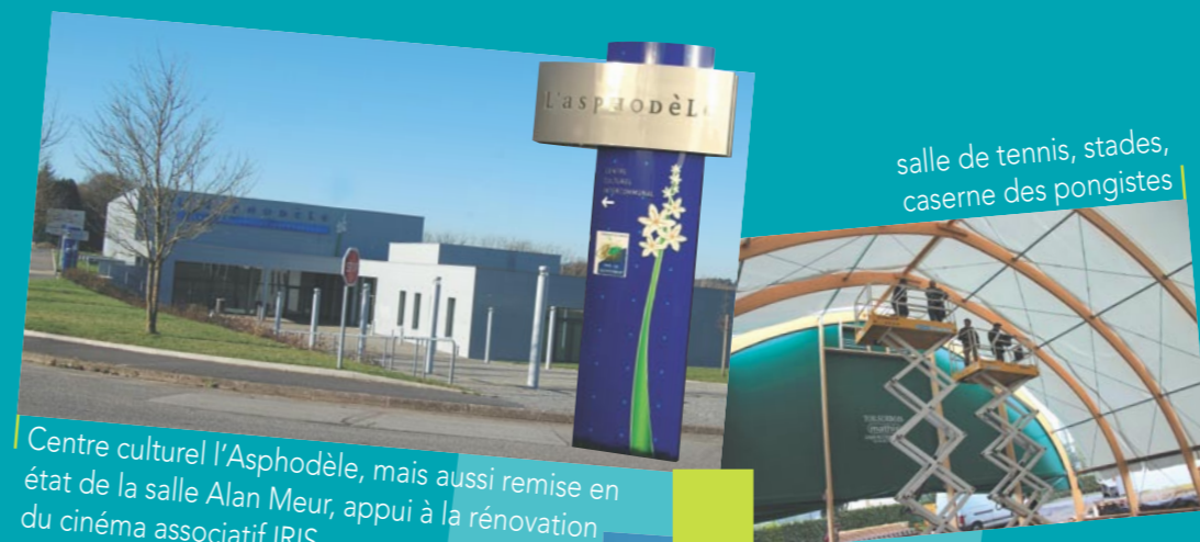
Centre culturel L'Asphodèle, mais aussi remise en état de la salle Alan Meur, appui à la rénovation du cinéma associatif IRIS