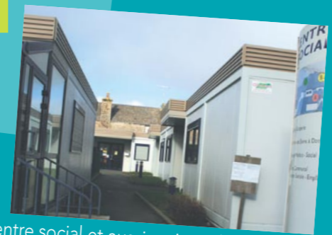
centre social et aussi maison de l'enfance