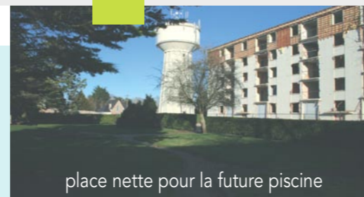
place nette pour la future piscine

Pour demain , nous allons vous proposer de construire avec vous une nouvelle étape du développement de la commune, une étape marquée par un engagement fort pour le développement durable et solidaire .