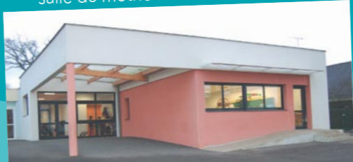
extension de l'école primaire ( mais aussi salle de motricité en maternelle),