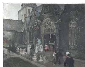
La Collégiale par A. Gumery

Semaine d'animations détaillée sur www.rocheforten-terre-tourisme.com , rubrique Sortir/Agenda.